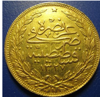
מימין - 100 קורוש, לירה זהב טורקית,

מטבעות הזהב הנוספות שהיו נהוגות אז בארץ היו 20 לירות איטלקיות של המלך ויטוריו עמנואל, עריכים שונים של הרובל הרוסי עם דמותו של ניקולאי השני, 20 מרק גרמני של וילהלם השני ושליטים גרמנים אחרים, 20 קרונות אוסטריות של הקיסר פרנץ יוזף, סוברנים שונים של המלכה ויקטוריה וכן גם מטבעות זהב טורקיות של 100 קורוש, שכוננו לירות זהב טורקיות.