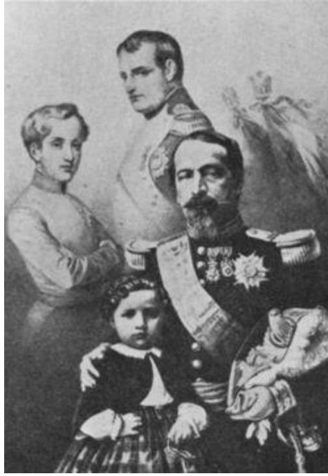
השושלת הנפוליאונית – מלמעלה, הקיסר נפוליאון בונפארטה הראשון, נפוליאון השני, הקיסר נפוליאון השלישי ובנו נפוליאון הרביעי.

כל הטרנזקציות הקרקעיות הגדולות של אותה תקופה בוצעו בנפוליאוניים מזהב, גם רכישותיו של יהושוע חנקין גואל אדמות העמק שולמו בזהב, אלא שלאחר הכיבוש הבריטי ב-1917 המטבע השולט היה הסוברין הבריטי. אותם 400 אלף פרנק זהב ששילמו התל אביבים עבור אדמתם היו 20.000 מטבעות של 20 פרנק זהב שמשקלן כ-130 ק"ג זהב, ערכן היום כ-5 מיליון דולר, אכן מחיר מציאה!